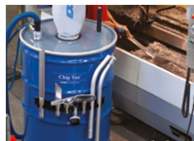
Odkurzacz do wiórów o pojemności 416l jest skutecznym w przypadku dużych operacji czyszczenia.