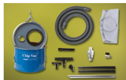
System mini odkurzacza do wiórów model 6193-5 obejmuje wąż ssący, beczkę o pojemności 19 l, rurę do wiórów i akcesoria z tworzywa sztucznego.

Sprężone powietrze, zazwyczaj pod ciśnieniem 5,5 – 6,9 bar, przepływa przez wlot (1) do komory pierścieniowej (2). Następnie jest wprowadzane do szyjki przez dysze kierunkowe (3). Powyższy strumień powietrza wytwarza podciśnienie na wlocie (4), które zasysa materiał i rozpędza go w urządzeniu (5), kierując go na dno beczki. Strumień powietrza wydostaje się przez otwór w pokrywie beczki. Częsteczki unoszące się w powietrzu są wychwytywane przez worek filtracyjny (6).