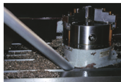
Odkurzacz do wiórów usuwa ostre wióry ze stali nierdzewnej z centrum obróbczego CNC.