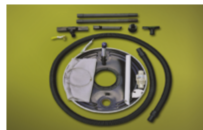
System odkurzacza do wiórów obejmujący wąż ssący, rurę do wiórów i akcesoria.